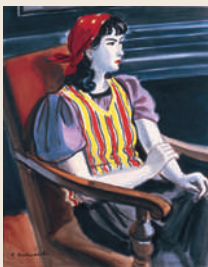
中西利雄《赤いスカーフ》1938年